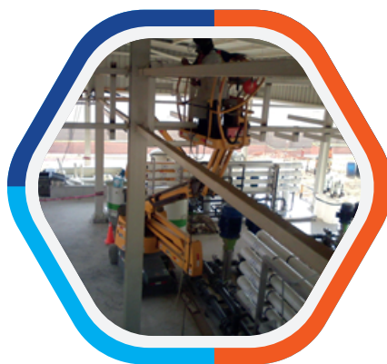
Montaje Electromecánico PTAP Osmosis Inversa - GRUPO SOIL