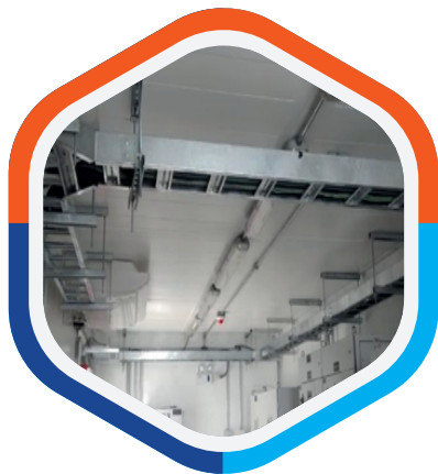
Montaje Electromecánico CCMS- DIMATIC