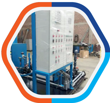
Fabricación de Tablero, Montaje Electromecánico - PLUBEMMETAL