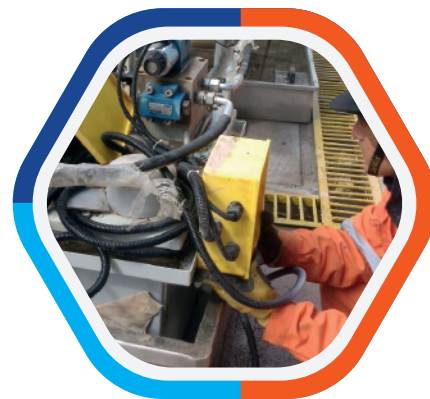
Montaje electromecánico y Puesta en Marcha PTAR - MINERA VOLCAN.