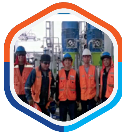
Montaje Electromecánico Central Termina RECKA - GRUPO SOIL