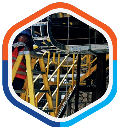
Montaje electromecánico de Chancadora D - MINERA YANAQUIHUA